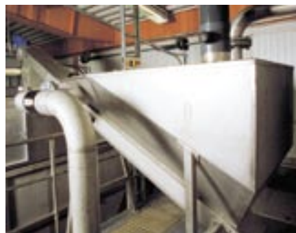
Installation av Läckeby Products avvattnare SA 260-50.

Som standard tillverkas avvattnaren i rostfritt material eller syrafast material. Den är utrustad med en axellös transportskruv, tillverkad i svart material, i botten av tråget. Tråget är belagt med slitjärn i Hardox eller med slitinlägg av Robalon.