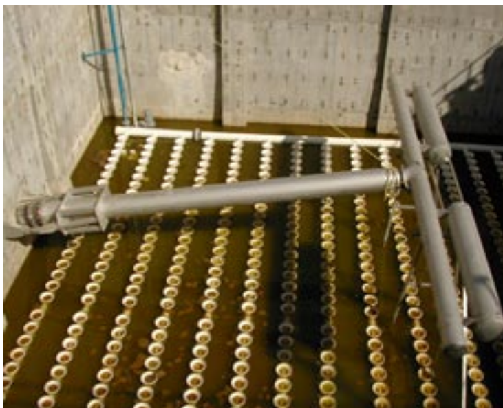
Läckeby Products dekanter installerad i Buenaventura, Chiapas i Mexiko.

Som standard tillverkas dekantern i rostfritt material eller syrafast material. Utloppsroret är försett med en flexibel koppling i nedre änden. Konstruktionen innefattar även stöd för dekantern vid tömning av SBR-bassängen. Läckeby Products dekanter kräver minimalt underhåll, eftersom den varken innehåller pumpar, ventiler eller elektriska drifter.